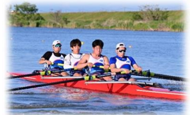
アウトドアスポーツ