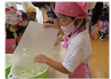
認定子ども園での食育の様子

県民が希望どおりに妊娠・出産し、安心して子育てができるよう、社会全体でそれらを応援する機運を醸成するとともに、市町と連携しながら、地域の実情を踏まえた支援を行い、それぞれの取組の充実を図ります。