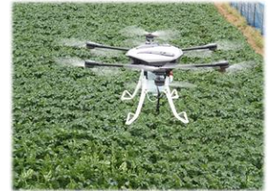
ドローンによる病害虫防除

また、本県の重要な基幹産業である農林水産業についても、生産性の向上・労働環境の改善を図るため、スマート農林水産業を推進します。