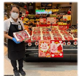
タイでの長崎フェア（農産物）