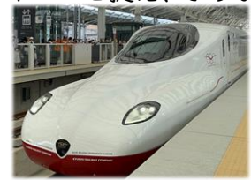
西九州新幹線「かもめ」N700S

また、JRグループや佐賀県等と連携し、「佐賀・長崎デスティネーションキャンペーン」を開催します。