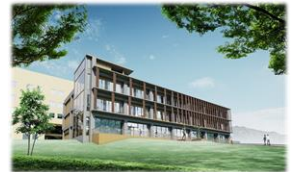
情報セキュリティ産学共同研究センター(仮称)

全国初の情報セキュリティ学科を有する長崎県立大学において、情報セキュリティ分野における産学官連携の拠点となるセンターを整備し、企業との共同研究等を推進するとともに、即戦力となる高度専門人材の育成と県内産業の振興を図ります。