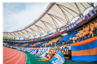
V・ファーレン長崎応援

選手・指導者の育成、スポーツ大会の開催、芸術関係の指導者等の育成や作品展開催などを支援します。