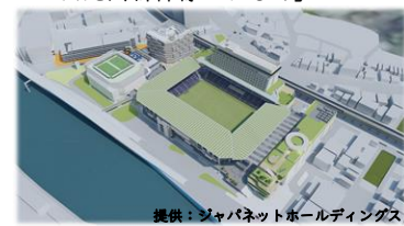
提供：ジャパネットホールディングス 長崎スタジアムシティプロジェクト ※構想段階のため今後デザイン含め変更の可能性があります

民間事業者が長崎市中心部の長崎駅周辺に整備するサッカースタジアムを核とした複合都市開発と連携を図り、誰もが楽しめる魅力あるまちづくりを推進します。