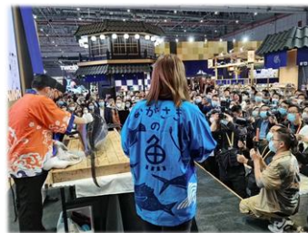
中国での展示商談会（水産物）

店舗内におけるテストマーケティングの実施等により首都圏消費者のニーズを把握し、県産品のブランド化・販路開拓の取組等を推進します。