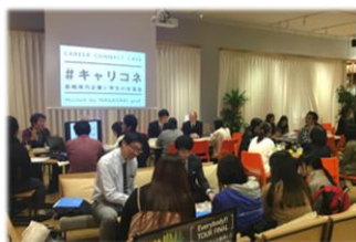
県内企業と学生の交流会

また、リモートワーク・ワーケーションなど、関係人口の創出・拡大にも取り組みます。