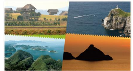
日本遺産「国境の島 壱岐・対馬・五島」