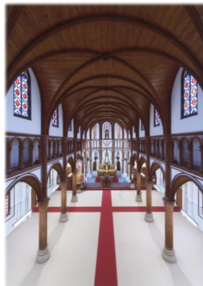
活用例：黒島天主堂の修復工事（佐世保市）

構成資産の情報発信や保護意識の醸成に取り組むとともに、受入態勢を充実させ、世界遺産価値の共感による満足度や再来訪意欲の向上に取り組みます。