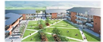
長崎県立大学佐世保校キャンパス整備イメージ

校舎建替えによる教育環境の充実を図るとともに、県内企業での長期インターンシップや「しま」でのフィールドワークなど地域に根ざした実践的教育により、地域を支える人材、主体性や課題発見力などを備えた人材の育成に取り組みます。