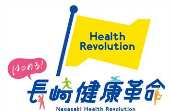
長崎健康革命ロゴ

健康長寿日本一を目指し、特に働き世代である30～50代をメインターゲットに「運動」「食事」等の生活習慣の改善にかかる取組が行いやすい環境の充実に取り組みます。