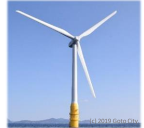
五島市沖浮体式洋上風力発電「はえんかぜ」