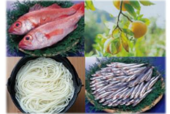
アカムツ(対馬市)、ゆず(壱岐市)、五島手延うどん(新上五島町)、きびなご(五島市)

原の辻遺跡や遣唐使、朝鮮通信使など国境の島が紡いだ2300年の魅力あるストーリーや文化資源を広く国内外に発信し、観光振興やふるさとへの愛着心醸成など地域活性化につなげていく取組を推進します。