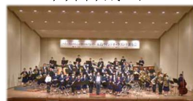
長崎しまの国際芸術祭 ～東京藝術大学と五島市民による合同演奏