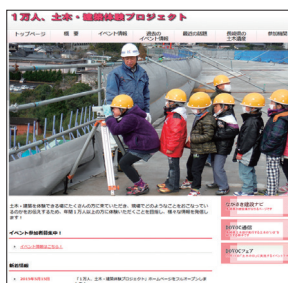
↑「1万人、土木・建築体験プロジェクト」ホームページ