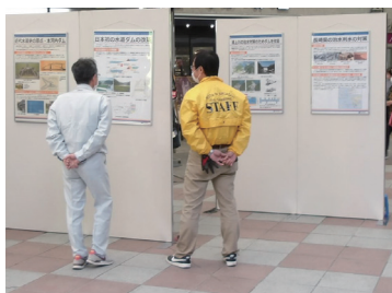
↑ パネルを用いて事業内容の説明をおこなっています。

例年県内各地で「土木の日」にちなんだイベントを開催しています。令和4年度は佐世保四ヶ町アーケード内で、【明日の暮らしを支える土木のチカラ】をテーマに「土木パネル・模型展」を開催し、多くの人で賑わいました。