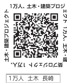
1万人 土木 長崎