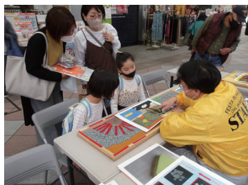
↑ 模型を使って、分かりやすく説明しました！