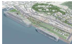
2隻のクルーズ船が着岸する長崎港のイメージ

多数の観光客が来訪する空港・港湾においては、大型クルーズ船の入港等による、周辺地区での交通混雑に適切に対応していく。