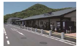
道の駅 させぼくす99（防災道の駅）

災害時の避難、救援活動、緊急物資集積地などの防災機能強化する。また、主要都市からのアクセスルートを確保する。