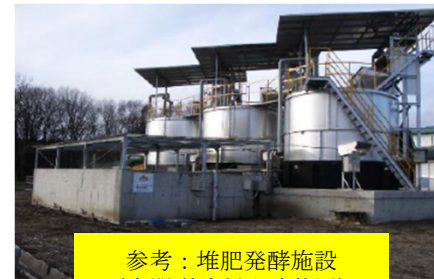
参考：堆肥発酵施設 (密閉型強制発酵装置)