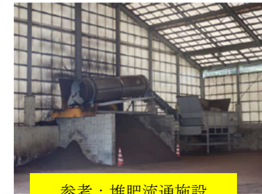
参考：堆肥流通施設