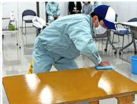
清掃(テーブル拭き)