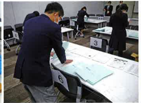
事務アシスタント