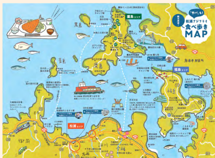
松浦アジフライ食べ歩きMAP