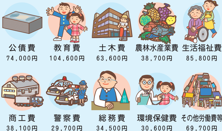
県民一人当たりの支出額 (令和5年度当初予算)