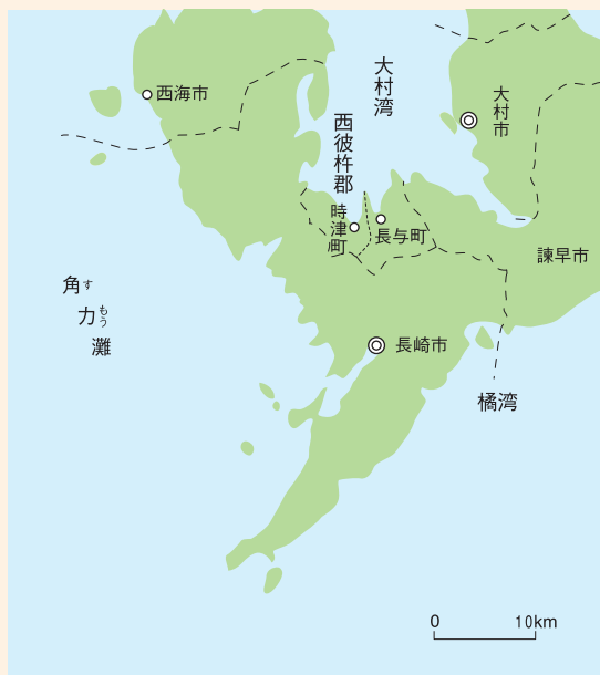
長崎市とその周辺