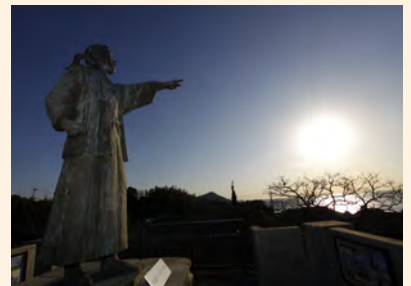
中浦ジュリアン像（提供:長崎県観光連盟）

西海市は、西彼杵半島の北部にあり、平成17年4月1日に西彼町、西海町、大島町、崎戸町、大瀬戸町の5町が合併して誕生した人口24,700人（令和5年10月）の市である。西海町中浦にある七ツ釜鍾乳洞は県内で唯一の鍾乳洞であり、1936（昭和11）年に国の天然記念物に指定された。近くには、南蛮船来航地として有名な横瀬浦中浦ジュリアン像 中浦ジュリアン像 （提供:長崎県観光連盟）や天正遣欧使節の一員であった中浦ジュリアン出生の地などの県指定文化財があり、歴史豊かなまちである。