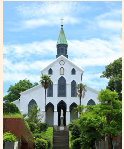
国宝大浦天主堂 （写真掲載に当たっては大司教区の許可をいただいています）

長崎市は、多くの史跡と美しい景観にめぐまれ、観光は重要な産業となっている。大浦天主堂 そう や崇福寺 ふくじ をはじめ、グラバー園 めがね 、眼鏡橋 めがねばし 、平和公園などへは県内外から多くの観光客がおとずれる。長崎くんちやランタンフェスティバルなどの年中行事やチャンポン、カステラなどの食べ物 い こくじょうちよ は、異国情緒あふれるものとして特に人気がある。