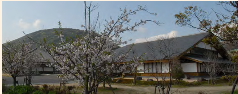
まちづくり景観資産に登録されている諫早市立森山図書館

諫早市の東部に位置する森山町には、緑豊かな景観にあう木造住宅や下水道が整い、国内最大級の瓦ぶき平屋建ての木造図書館がある。この諫早市立森山図書館は、県のまちづくり景観資産に登録され、地元で親しまれている。南部の飯盛町では、田結港が整備され、漁港と隣接して人工海水浴場も建設された。町民いこいの森で知られている東部に位置する高来町には、林野庁から「水源の森百選」に、環境省から「名水百選」に選定されている轟溪流がある。多良岳は、国の天然記念物のシャクナゲが自生し、自然の宝庫となっている。また、小長井町では、山茶花高原を中心とした観光レクリエーション施設にハーブ園も加わり、観光と結びつけた農業が考えられている。西部の多良見町は、みかんの生産が有名である。また、長崎空港を眼下に望む自然豊かな公園や展示回廊、ホール等を備えた図書館があり、多くの市民が集まる場となっている。