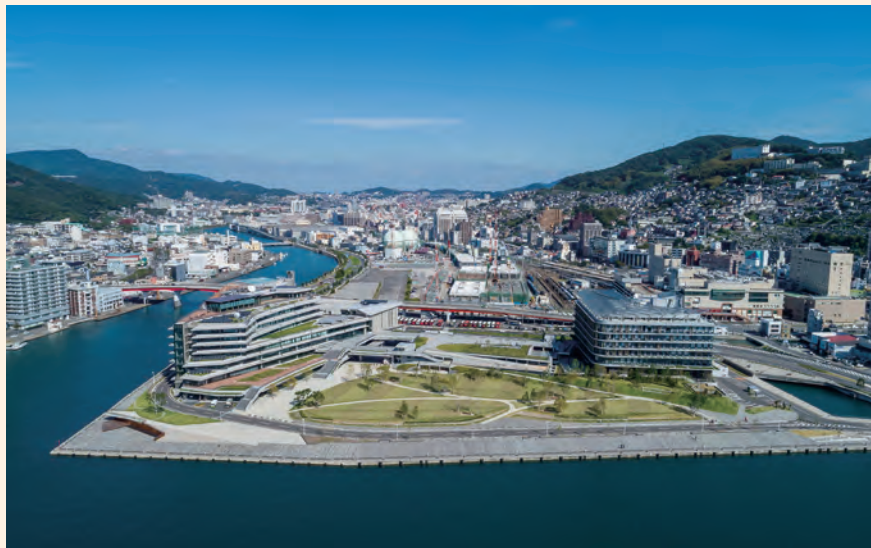
県庁舎と非常時に災害救援活動の場となる防災緑地

人口393,597人（令和5年10月）の長崎市は、県庁所在地として、県の行政、経済、文化などの中心となっている。官公庁、銀行、会社や商店などが集まり、また、美術館や博物館、総合体育館など県や市の公共施設も多い。また長崎港周辺地区では、2000（平成12）年に創設された「環長崎港地域アーバンデザイン会議」の専門家からのアドバイスを受けて、美しい都市景観の創造に務めている。