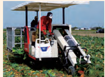
大規模営農のようす（大型機械による収穫）