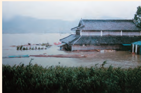
床上浸水の被害のようす

諫早湾の大規模干拓構想は、1952（昭和27）年に、戦後の食糧難を解決すること等を目的として「長崎大干拓構想」が、1970（昭和45）年には「長崎県南部総合計画」が検討された。その後、長崎大水害（昭和57年）の経験を踏まえ、防災面を重視する計画とし、1997（平成9）年に潮受堤防が締切られ、1999（平成11）年には潮受堤防が完成し、現在では、高潮や洪水などに対する防災機能が十分に発揮されている。干拓事業は2008（平成20）年に完了し、約700haもの広大で平坦な優良農地が造成された。また、潮受け堤防と干拓地の間には約2,600haの調整池ができ、干拓地の水源になるとともに、新たな水辺環境が創出された。