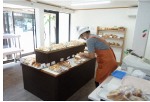
パン袋詰め・陳列