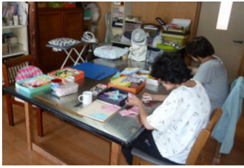
事業所での小物作り