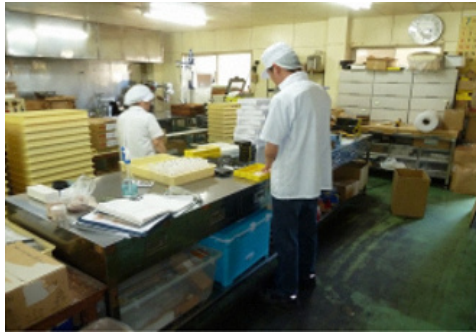
施設外作業（菓子製造）