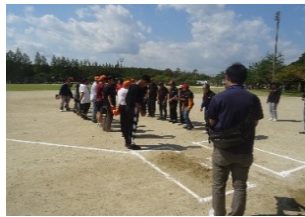
ソフトボール大会