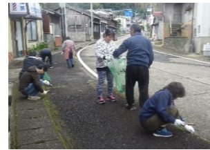
ボランティア清掃