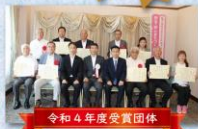
令和4年度受賞団体