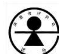
(b) 特別用途食品の標識