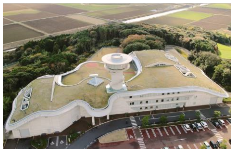
長崎県埋蔵文化財センター・壱岐市立一支国博物館