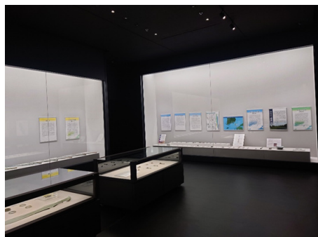
巡回遺跡展（対馬市）