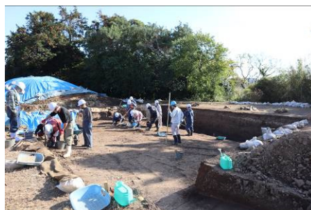
原の辻（関繰）遺跡の発掘調査