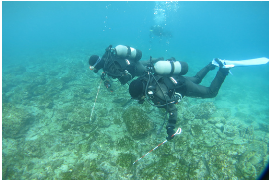
水中遺跡の分布調査

県内全域を対象にした水中遺跡の分布調査を行い、その所在や内容を把握し、周知を進めることにより、海洋開発と水中遺跡保護との調整を図る。