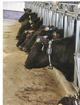
発情通知機器（首輪）