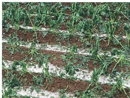
降雪によるブロッコリー茎葉被害