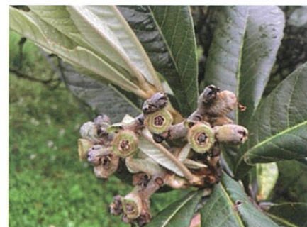
寒害によるびわ果実被害