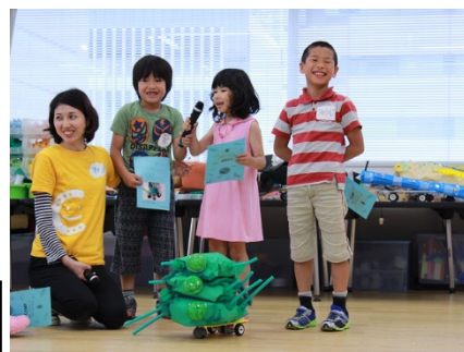
【CAMPワークショップコンセプト】