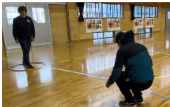
足じゃんけん陣取り

いつの間にか「ジャンプのコツ」を身に付けることができるような場の設定の例です。場を設定する際には、安全な場所かどうかを確認してください。