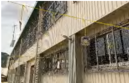
思わずジャンプしたくなるような場1