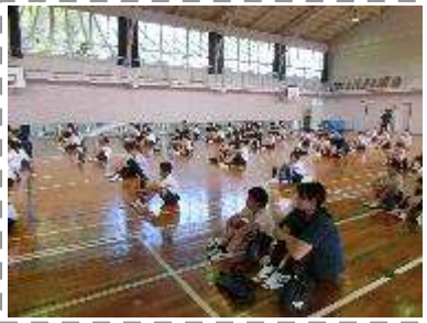
ファミリーフィット!