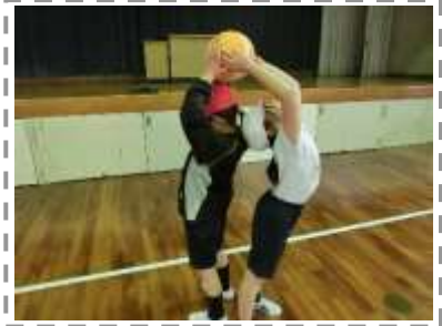
フィットネスチャレンジながさき

(児童の様子等) 自然と体を動かしたり、自分だけでなく他者とのふれあいを通して楽しく活動する姿が多く見られた。