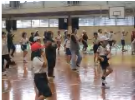
元気アップファミリーフィット