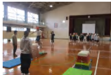
アスリート派遣事業