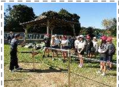
体育学習サポーター

(児童の様子等) 運動のコツを自分なりに考えて理解し、実際に試してみるにより技能を習得し喜ぶ児童の姿が見られ、『できた!』『楽しい!』といった声を聞くことができた。また、教師は児童への効果的な声かけや授業のねらいを明確にすることで、授業改善を図ることができた。