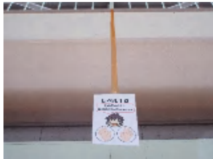
学校をプレイパークに!