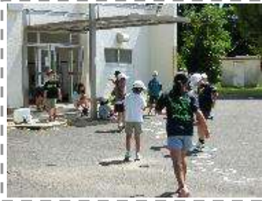
学校をプレイパークに!