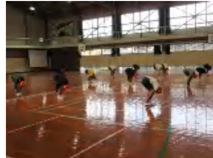
正しい形でのジャックナイフストレッチ