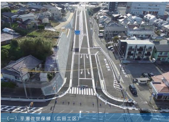
（一）平瀬佐世保線（広田工区）