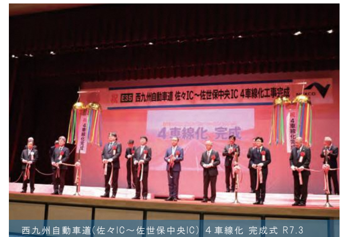
西九州自動車道(佐々IC～佐世保中央IC) 4車線化 完成式 R7.3