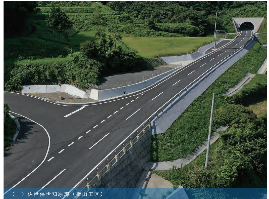
（一）佐世保世知原線（板山工区）