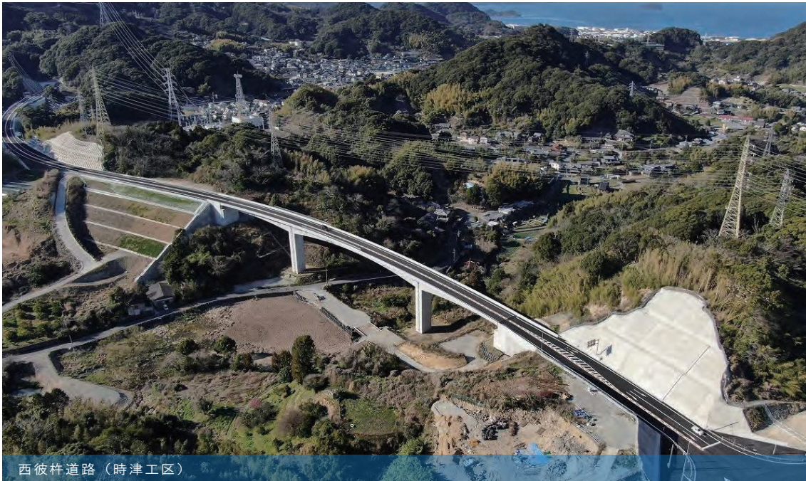
西彼杵道路（時津工区）