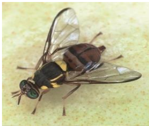
← ミカンコミバエ成虫

寄生する植物:かんきつ類、びわ、ぶどう、もも、なし、かき、いちじく、オリーブ、すもも、マンゴー、パパイヤ、パッションフルーツ、ドラゴンフルーツ、いちご、カボチャ、キュウリ、スイカ、ニガウリ、トマト、ナス、シシトウガラシ、ピーマン、パプリカ等