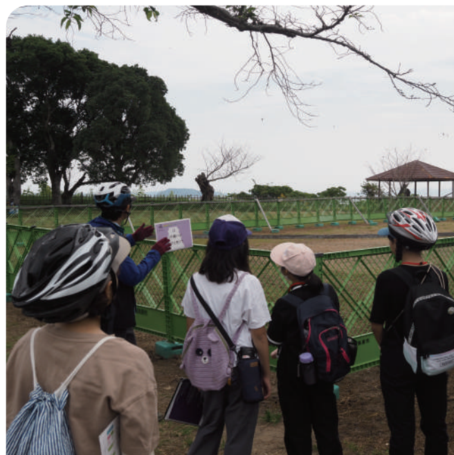
世界文化遺産 原城