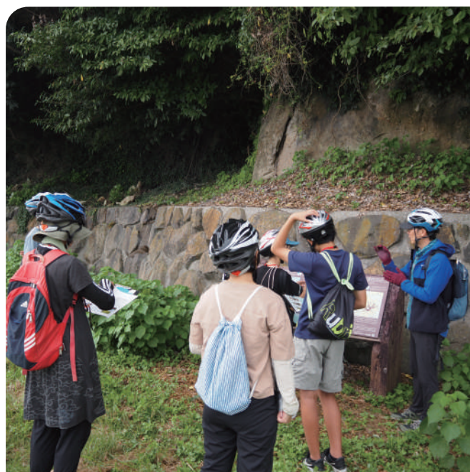
世界文化遺産 原城