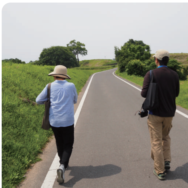
世界文化遺産 原城