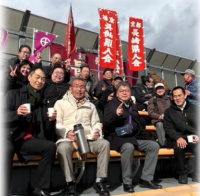
県人会応援の様子

1月11日、京都で開催された「第44回全国都道府県対抗女子駅伝」において、長崎県チームは総合成績で18位でした。終了後に開催された京都長崎県人会による長崎県選手団慰労会では、参加者全員で選手の皆さんの健闘を称え、選手の皆さんは、温かい応援に感謝するとともに、今後の活躍を誓っていました。