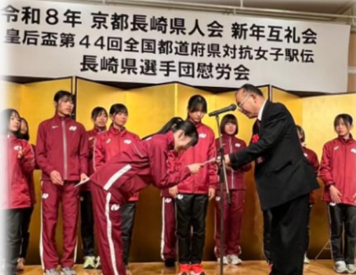
長崎県選手団慰労会の様子