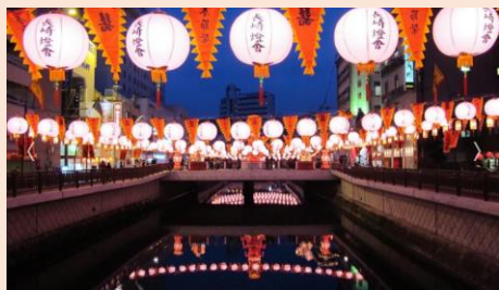
ランタンフェスティバル（長崎市）