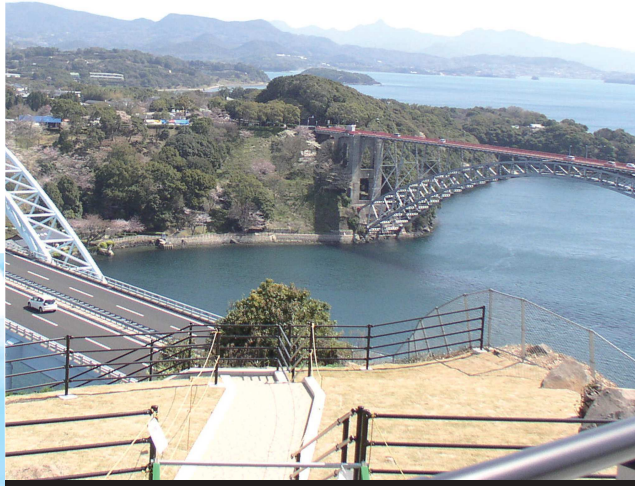
②西海橋と新西海橋/新西海橋の橋下には歩行者専用道路と展望台がある。展望台からは眼下に逆渦巻く渦潮を眺めることができる。

In the first half of the course you'll enjoy a variety of natural beauty from the moment you leave Yamauchi bus stop all the way to the Nanatsugama Limestone Cave. The Isanoura Valley cut out of the foot of Mt. Shiratake is also a nice spectacle. From the observatory at the Seihy Youth Outdoor Learning Center at the top of Mt. Kokuzou, you can overlook the entire northern part of the prefecture. In the second half of the course you'll make your way along the deeply indented coastline from Mt. Kokuzou through Segawa Port, around Omura Bay, and finally through Saikaibashi Park to get to Hario Strait. The whirlpools of Hario strait, which are one of Japan's three major rapids, are one of the best parts of the trip.