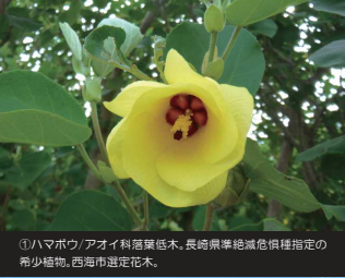
①ハマボウ/アオイ科落葉木。長崎県準絶滅危惧指定の希少植物。西海市選定花木。