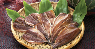
⑥みりんぼし/平戸海産で獲れる上質なあご(魚骨)を用いたみりん干しは酒の肴にも最高。