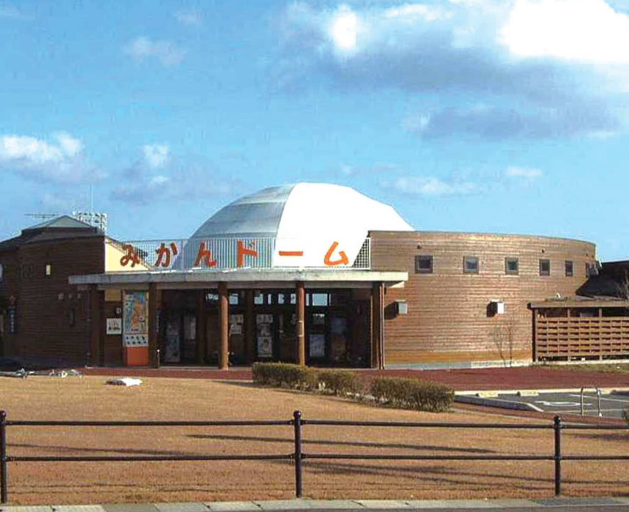
③道の駅さいかいみかんどーム/半円形の大きなドーム型テントが際立つみかんどームは、西海市のお土産品と観光情報提供と幅広く揃えている。