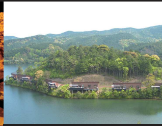
⑤伊佐ノ浦公園/森林浴や自然散策、バスフィッシングなど、美しい自然のなかでさまざまな体験が楽しめる。また、コテージやバンガローなどの宿泊施設もある。