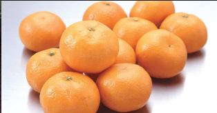
⑦みかん/肥料や栽培方法にこだわったみかんは色が濃く糖度が高いのが特徴。