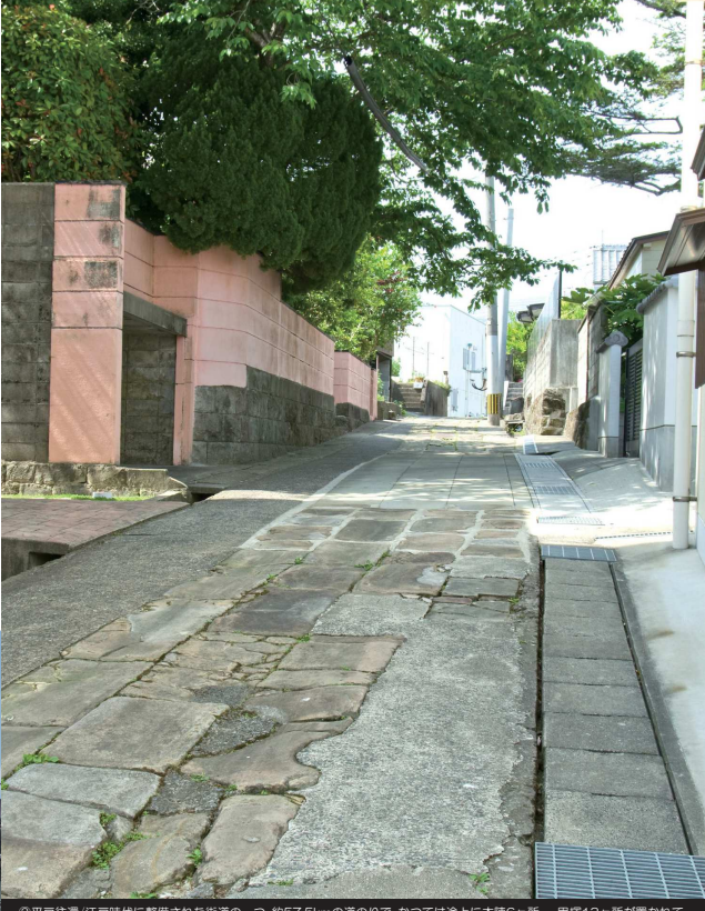
②平戸住道/江戸時代に整備された街道の一つ。約57.5kmの道のりで、かつては途上に本陣6ヶ所、一里塚13ヶ所が置かれていた。