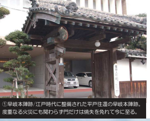
①早岐本陣跡/江戸時代に整備された平戸住道の早岐本陣跡。度重なる火災にも関わらず門だけは焼失を免れて今に至る。

【Course Guide】 On this course guests will walk the gentle slopes along Omura Bay through Mandarin orange groves and rice paddies, following the Haiki Strait to Kancho Bridge. From there they'll pass through the city area to the mecca of Sasebo's trails, Mt. Kaku, where the trail rises and falls gently with the mountain ridge. The area around Mt. Kunimi is the best in the prefecture for bird watching so please come enjoy the view of Mt. Eboshi while listening to the sounds of the bountiful nature where those wild birds live.