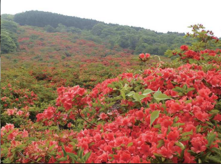
④隠居岳ヤマツツジ/4~6月にかけて隠居岳に自生するヤマツツジが一斉に開花し、隠居岳を紅く染め上げる。