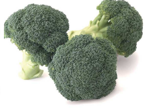
⑧ブロッコリー/特異な地形を利用した栽培方法や、水陸の出荷等により、高品質で新鮮なブロッコリーの供給を可能にしている。

⑥Mandarin Orange/Mandarin oranges are especially deep in color and contain a high amount of sugar due to the rigorous caretaking procedures adopted by the cultivators. 産量/質選別 検査の徹底、独自の栽培方法による生産、サイカイの濃い色、糖度が高いのが特徴。