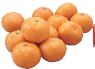
⑥みかん/肥料や栽培方法にこだわったみかんは色が濃く糖度が高いのが特徴。