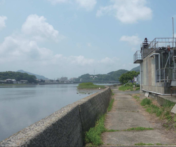
③早岐瀬戸/水深が浅く、流れが速い。かつては海上交通の要路であった。