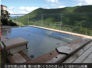
⑤世知原山脈麓/黒川紀彦(くろがわきしよ)設計の山脈麓(やまのれん)は、露天風呂から眺める深い緑の山々が絶景。見ている人に癒しを与える。