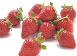
⑦いちご/佐世保市・平戸市・松浦市の3市で「長崎いちご」を栽培。西海市と佐世保市にはいちご狩りができる施設もある。