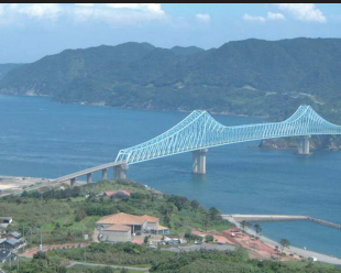
⑥ 生月大橋/平戸島と生月島をつなぐ大橋。橋の色であるスカイブルーは海の色とマッチしてとても美しい。