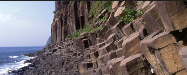
④ 塩原の断崖/柱状節理の見事な景観の断崖。長崎県新観光百選にも選ばれている。