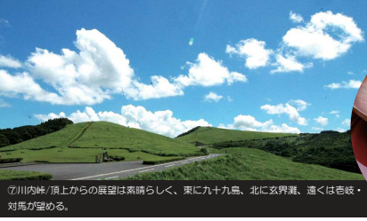
⑦ 川内峠/頂上からの展望は素晴らしい。東に北九州市、北に玄界灘、遠くは香鼓・対馬が望める。