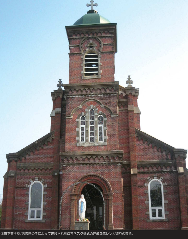
③ 田平天主堂/信者達の手によって建設されたロマネスク様式の荘厳な赤レンガ造りの教会。

The other available course also starts from the town of Himosashi but heads northeast into the city. The views of the terraced rice fields spread out on the mountainsides on Hirado Island are both culturally interesting and quite beautiful. Also, the views from the park at Kawachi Mountain Pass, which is the face Saikai National Park, are also wonderful to behold.