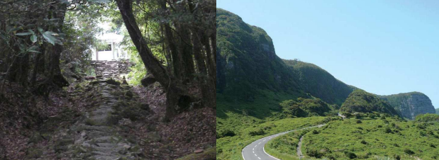
① 安流岳 標高が534mあり、世界遺産登録が期待されている。頂上には園路が整備されており、豊かな原生林を楽しめる。