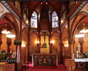
⑤ 山田教会/鉄川と助設計のロマネスク様式でレンガ造りの教会。室内には4つの殉教のレリーフなども飾られている。