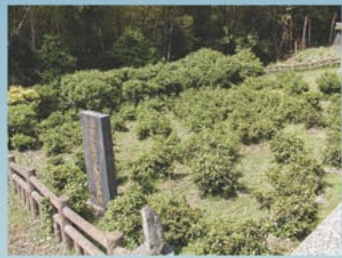
平戸市・富春園跡