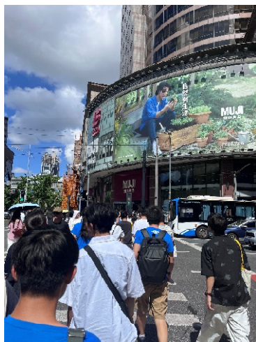
「無印良品」の店舗見学の様子