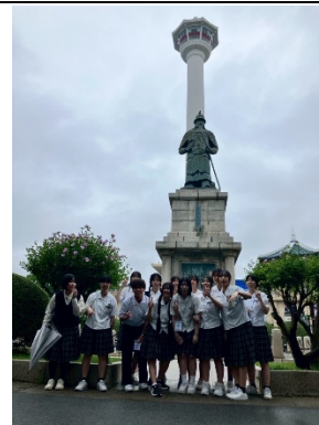
釜山郊外研修の様子