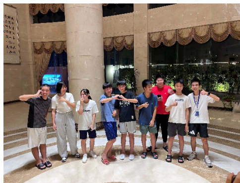
マカオの中高生との交流の様子