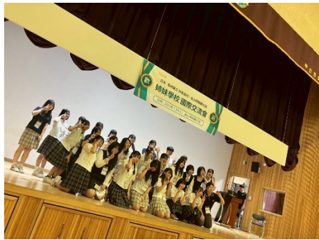
観光情報高校訪問の様子