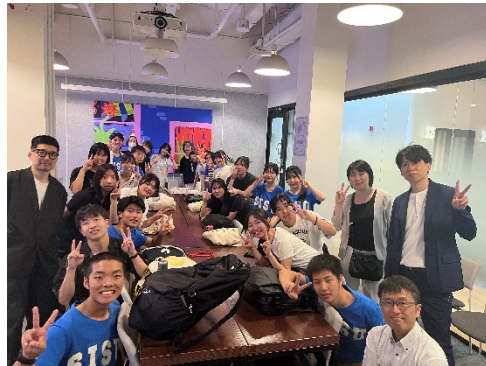
「内田洋行」での企業研修の様子