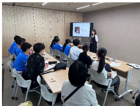
「無印良品」での企業研修の様子