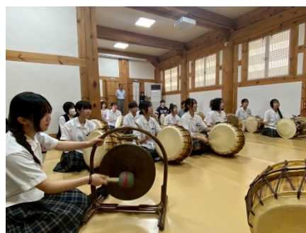
伝統楽器体験の様子