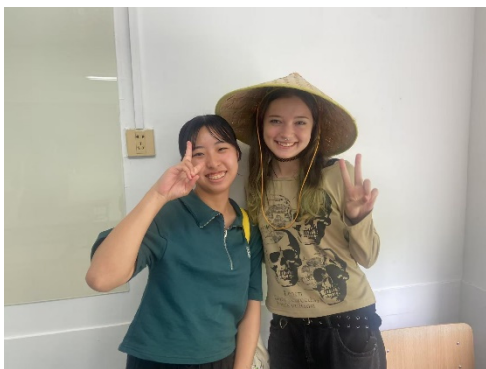
クラスメイトとの交流の様子