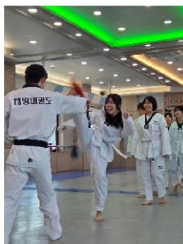
テコンドー体験の様子