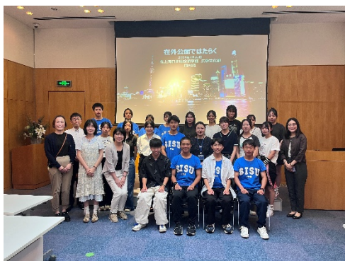
「日本国駐上海総領事館」での企業研修の様子