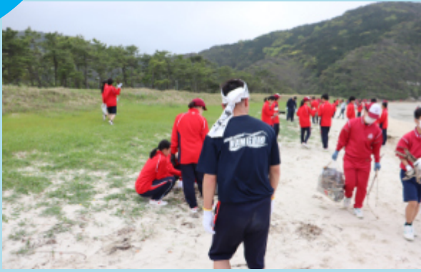
地域清掃ボランティアに参加