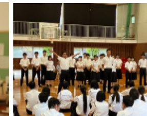
大学入試共通テスト100日前集会