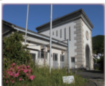
↑明洋館（セミナーハウス）