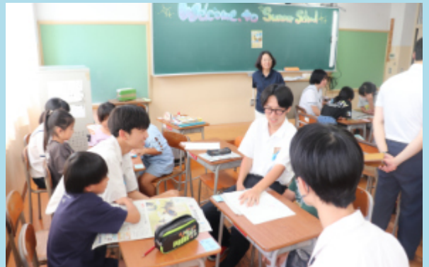
小学生向けのサマースクールの開催