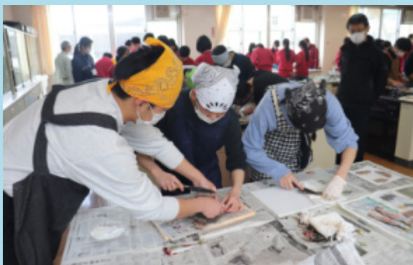
お魚さばき方教室への参加