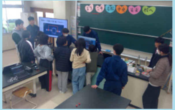
小学校への出前授業