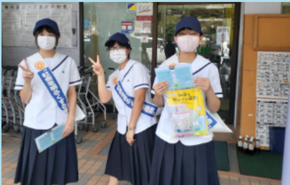
社会を明るくする運動に参加