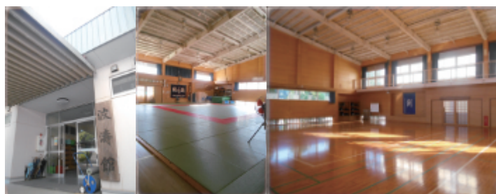
←波濤館（柔道/卓球/剣道）