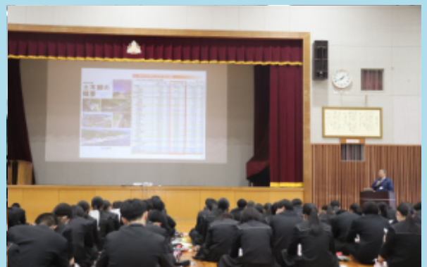
島内進路学習会の実施